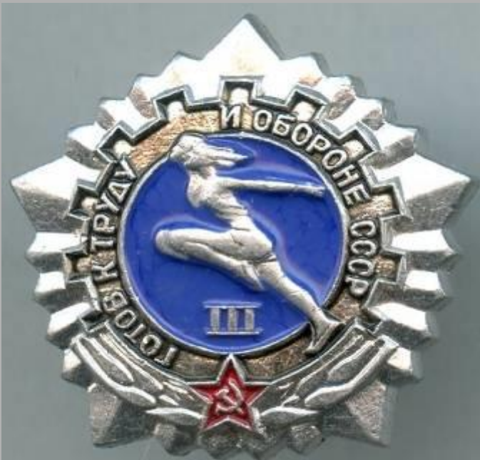
Серебряный значок ГТО