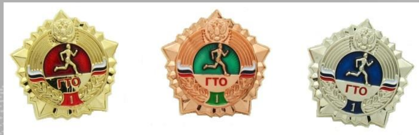
Новые значки ГТО образца 2014 года