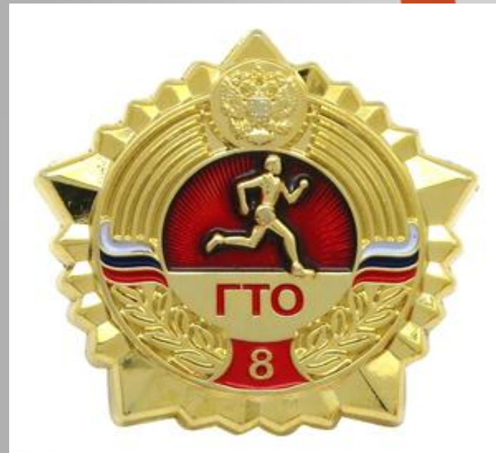
Золотой значок ГТО