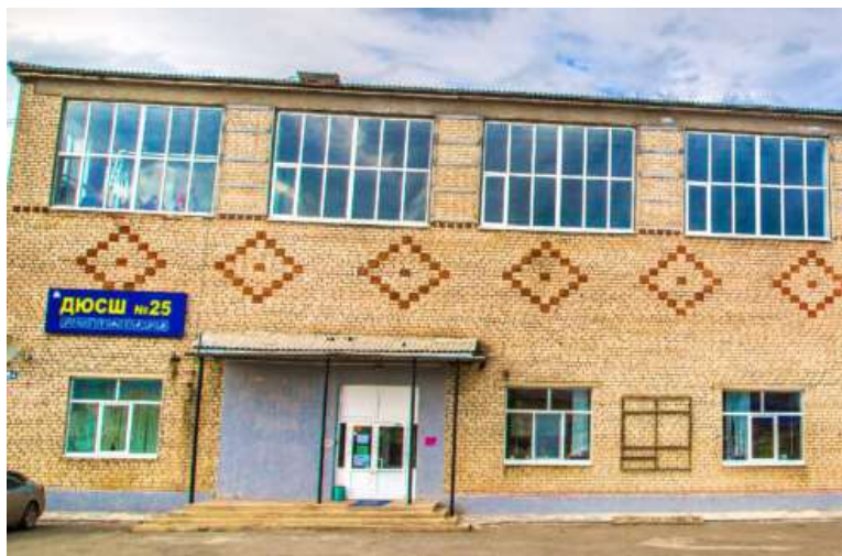
МАОУ ДО «ДЮСШ» №25