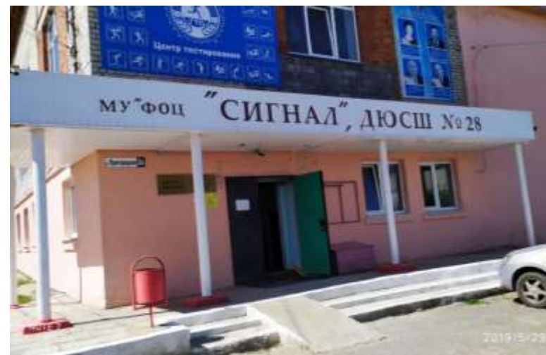
МБУ ФОЦ «Сигнал»